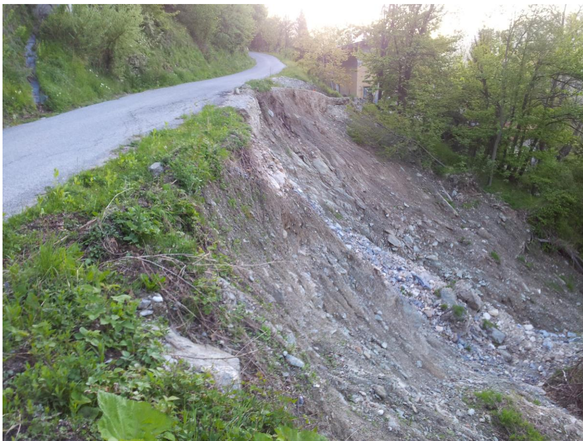
Foto 3: particolare del movimento franoso che si è innescato a valle della strada.