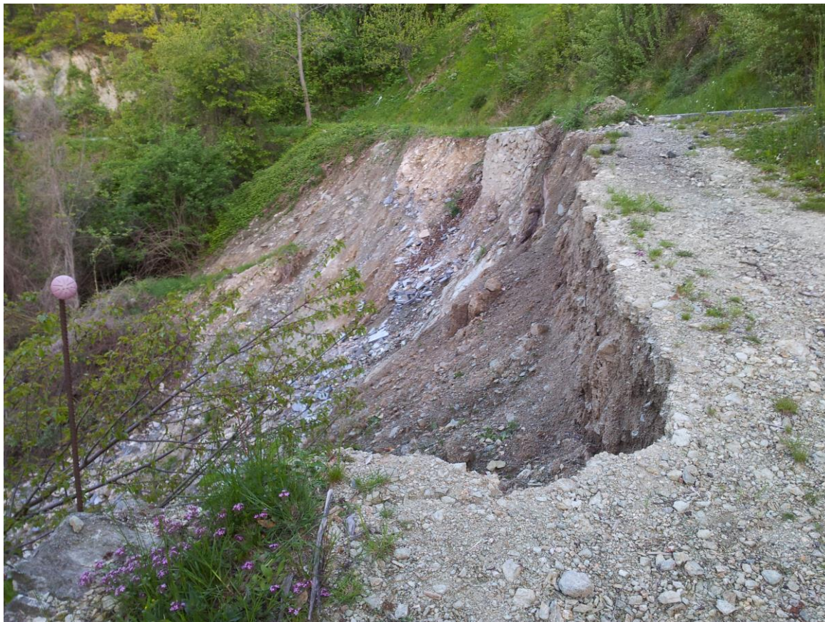
Foto 4: particolare delle nicchia di distacco. Si nota una porzione residua del muro preesistente