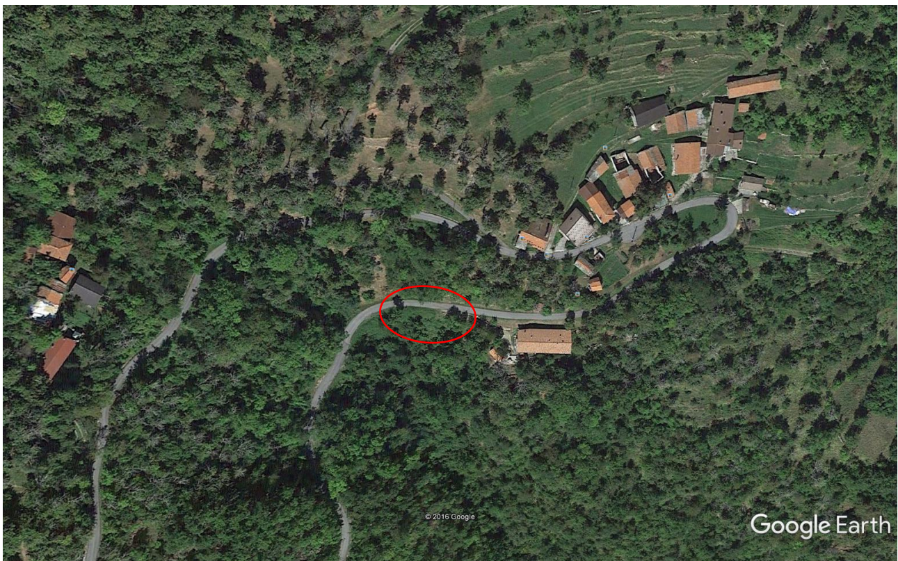
Foto 1: inquadramento aereo dell'area di intervento antecedente all'evento alluvionale.